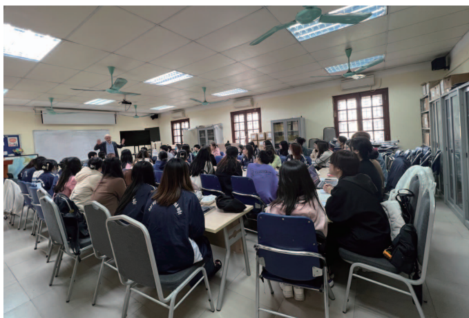
ブロン博士の講義に熱心に耳を傾けるVNUの学生