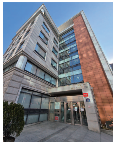
高麗大学校の青山・MK文化館には、グローバル日本研究院を含む様々な研究機関が所在する。

2007年、韓国の教育部は、人文学研究を促進する目的で、「人文韓国=Humanities Korea」事業（通称HK事業）を立ち上げた。グローバル日本研究院は、このHK事業に参加した最初の日本関連研究団体のひとつである。「私たちの狙いは、日本研究のグローバル・ハブとなる拠点を設立することでした。高麗大学校から多くの研究者が参加し、強力なインフラが整ったことで、私たちは国際的な学术交流の促進に力を注いできました。」