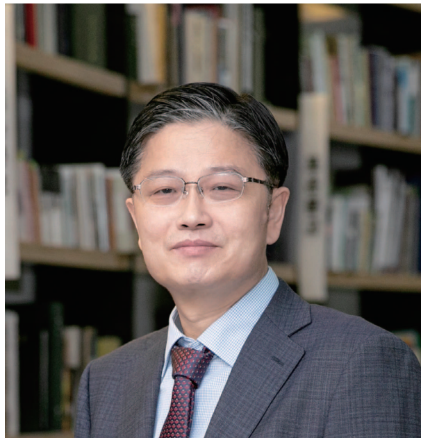
高麗大学校・グローバル日本研究院院長の 鄭炳浩(チョン・ビョンホ)教授